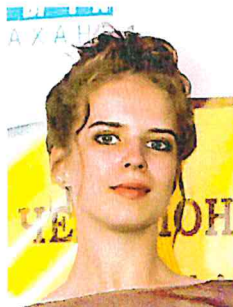
Офицер по связи с участниками