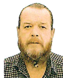
Комендант Парка сервиса (бивуака)